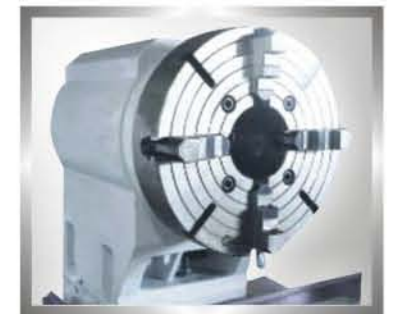
特制尾座(搭配加装夹头)