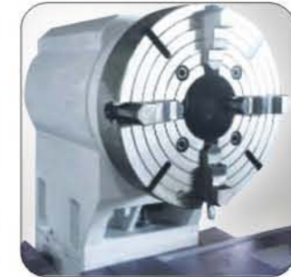
特制尾座(搭配加装夹头)